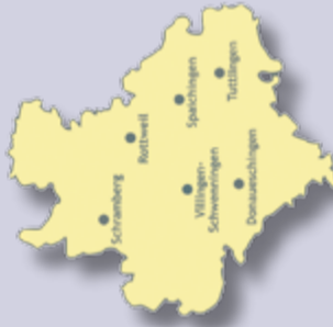
Das Einzugsgebiet des Marketing-Clubs entspricht in etwa den drei Landkreisen Rottweil, Tuttlingen und Schwarzwald-Baar.

Mitglieder eines Marketing-Clubs können auch alle anderen Marketing-Clubs in Deutschland besuchen. Nicht selten bestehen darüber hinaus Verbindungen zu weiteren internationalen Wirtschaftsklubs.